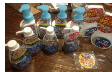
近隣企業から提供頂いた消毒剤