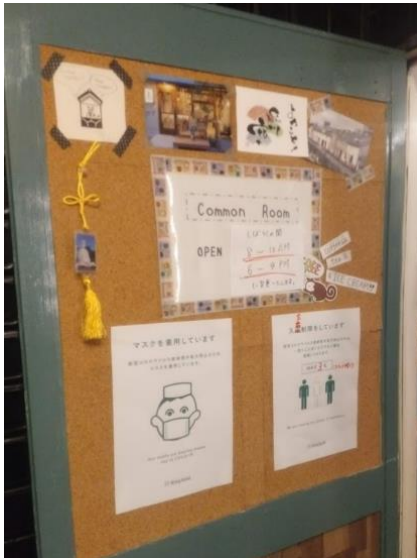
感染防止対策を説明・徹底

当施設は素泊まりの宿泊施設のため、滞在者の生活に必要な物資や食料の提供などは近隣から協賛を募集し、滞在者の快適な滞在をサポート行う。