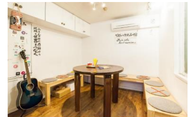
利用制限を設けた共有スペース

今回、5月4日の緊急事態宣言延長を受け、期間限定で滞在場所に困るワーキングホリデー目的などの外国人（マイノリティ）滞in者に対して、感染拡大防止を意識した滞在を「無料」で提供する。