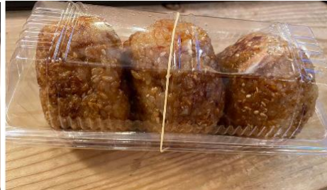
近隣のカフェから頂いた焼きおにぎり